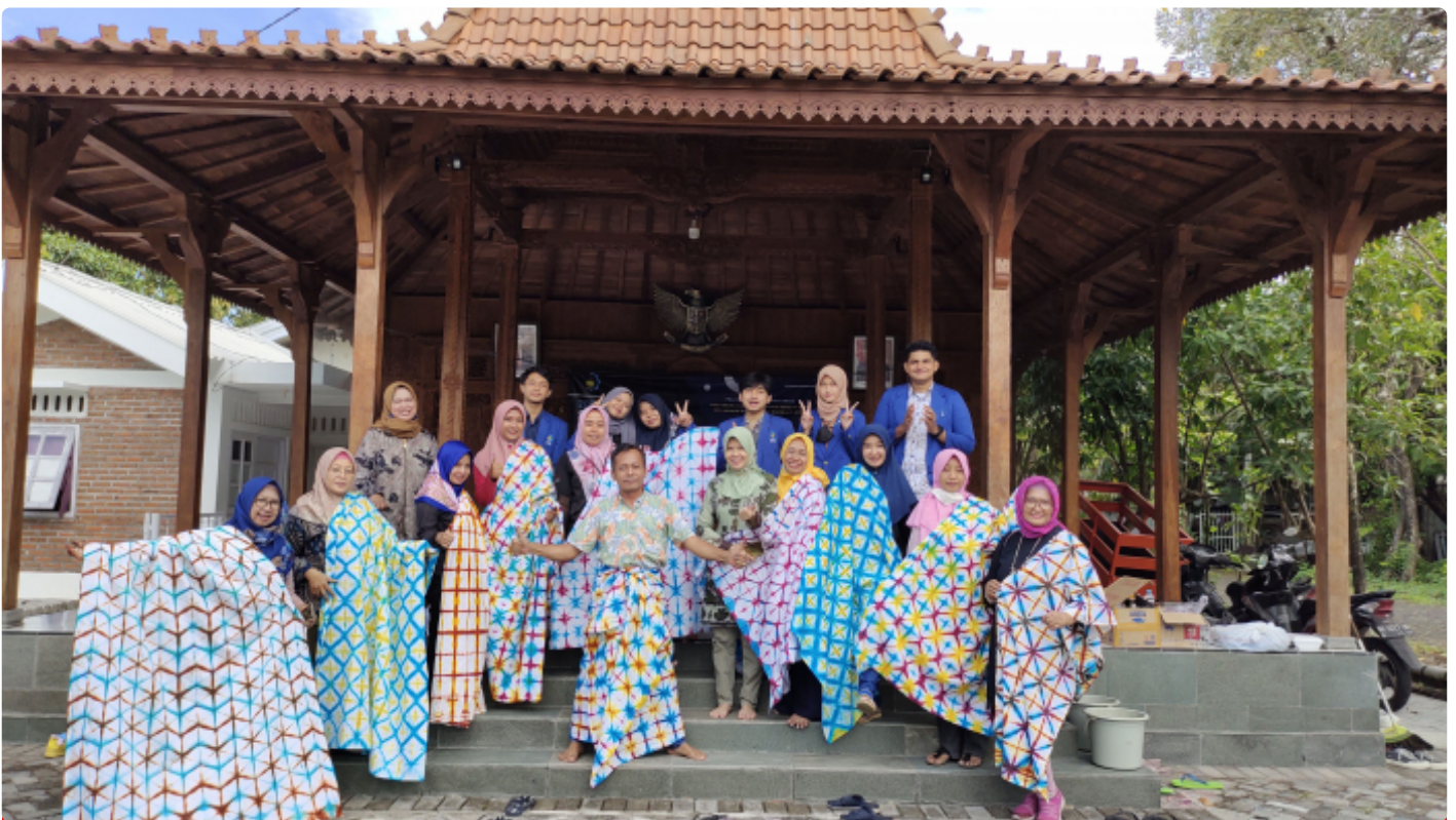
Para Peserta KKN Abmas Shibori menunjukkan hasil karyanya

SURABAYA – Tim Kuliah Kerja Nyata Pengabdian kepada Masyarakat (KKN Abmas) Institut Teknologi Sepuluh Nopember (ITS) mengenalkan Batik Shibori sebagai peluang bisnis yang besar. Maka dari itu, agar ITS selalu berkontribusi terhadap warga sekitar, pelatihan hingga pendampingan digelar dengan menyasar Masyarakat Berpenghasilan Rendah (MBR) Kelurahan Keputih.