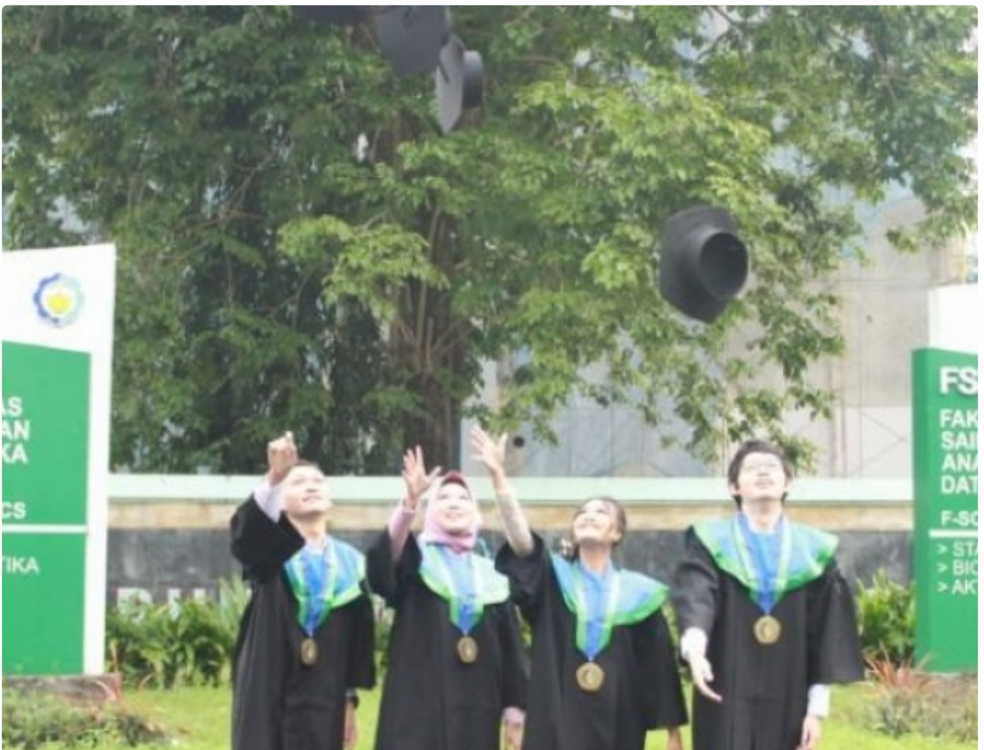
Ke empat wisudawan angkatan pertama Departemen Aktuaria ITS di depan Menara Sains, Sabtu (26/3)

SURABAYA – Departemen Aktuaria Institut Teknologi Sepuluh Nopember (ITS) yang resmi didirikan pada 2018 lalu telah meluluskan talenta-talenta terbaiknya untuk pertama kali. Aktuaria ITS telah meluluskan empat mahasiswa angkatan pertamanya pada Wisuda ke-125 yang diselenggarakan, Sabtu (26/3/2022).