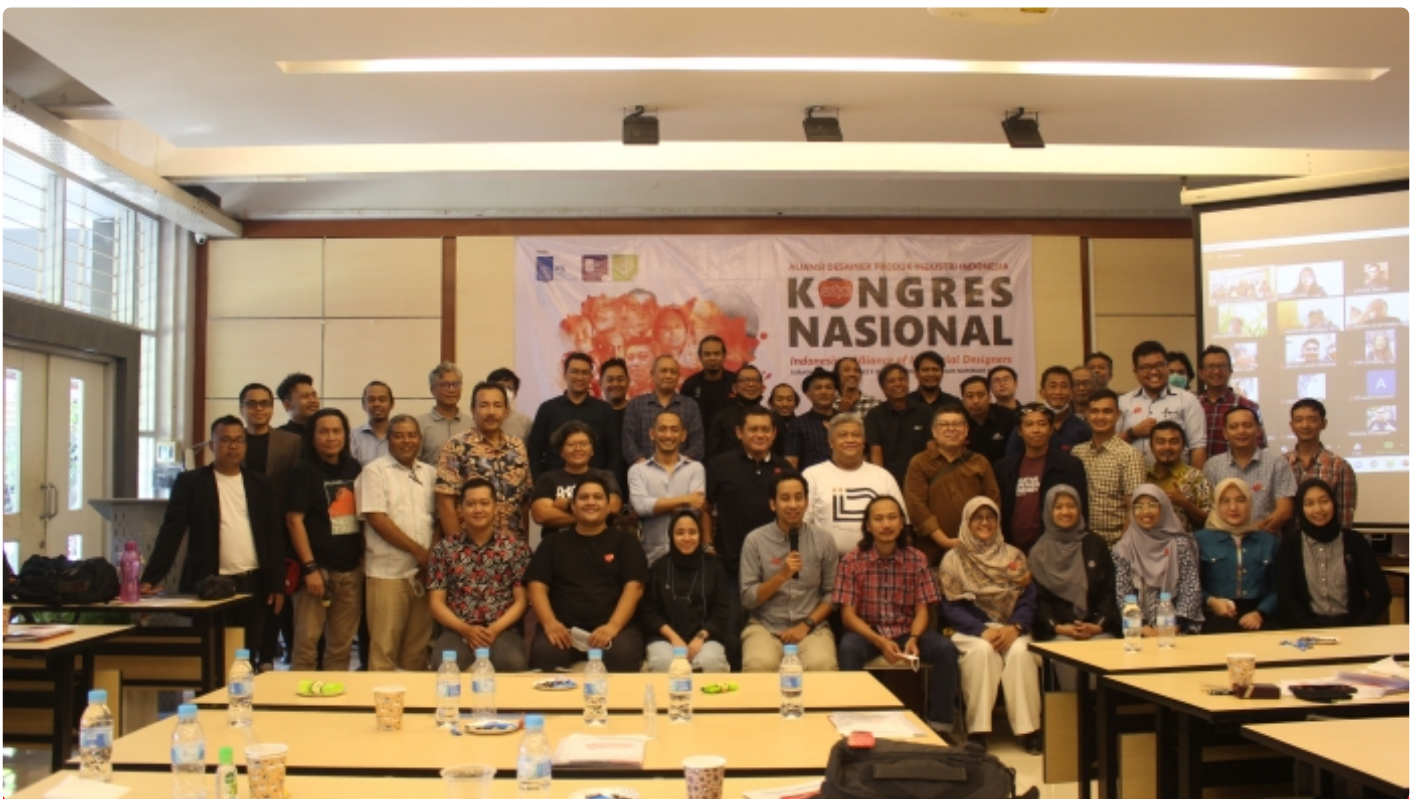
Foto bersama para anggota saat kegiatan Kongres Nasional ADPII

SURABAYA – Helatan rutin Kongres Nasional diadakan kembali digelarnya Aliansi Desainer Produk Industri Indonesia (ADPII). Pada kongres kali keempat ini, Institut Teknologi Sepuluh Nopember (ITS) dipercaya untuk menjadi tuan rumah sekaligus menjadi momentum serah terima kepemimpinan ADPII periode 2020-2022 ke periode 2022-2024. Kali ini, perhelatan bertempat di Gedung Desain Produk ITS, Sabtu (20/8/2022).