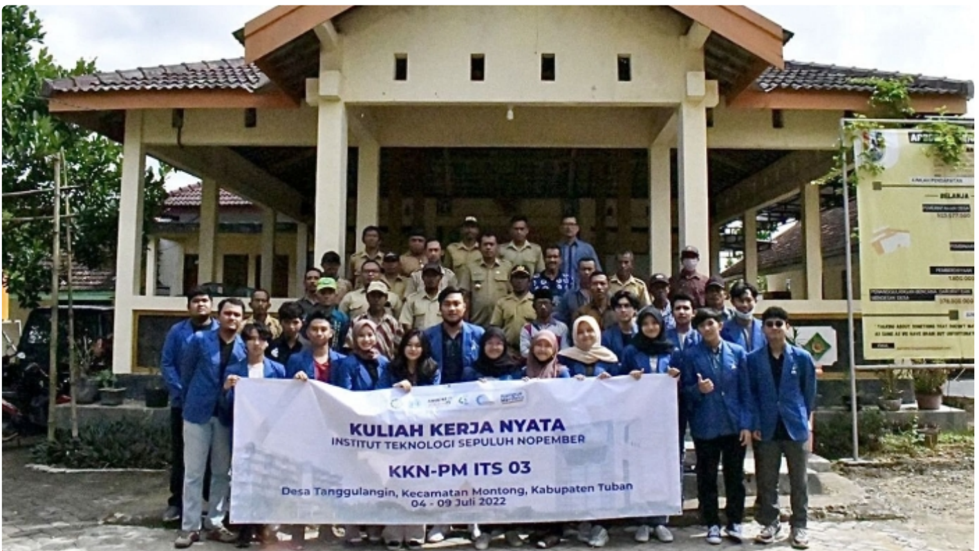
Tim Kuliah Kerja Nyata Institut Teknologi Sepuluh Nopember (ITS) berfoto bersama di Balai Desa Tanggulangin, Montong, Tuban, Jawa Timur

SURABAYA – Minimnya sistem penerangan jalan yang layak menjadi salah satu keluhan dari masyarakat Desa Tanggulangin, Montong, Tuban, Jawa Timur. Berangkat dari masalah tersebut, tim Kuliah Kerja Nyata (KKN) Institut Teknologi Sepuluh Nopember (ITS) membuat sistem Penerangan Jalan Umum (PJU) Tenaga Surya (TS) guna memudahkan mobilitas masyarakat sekitar.