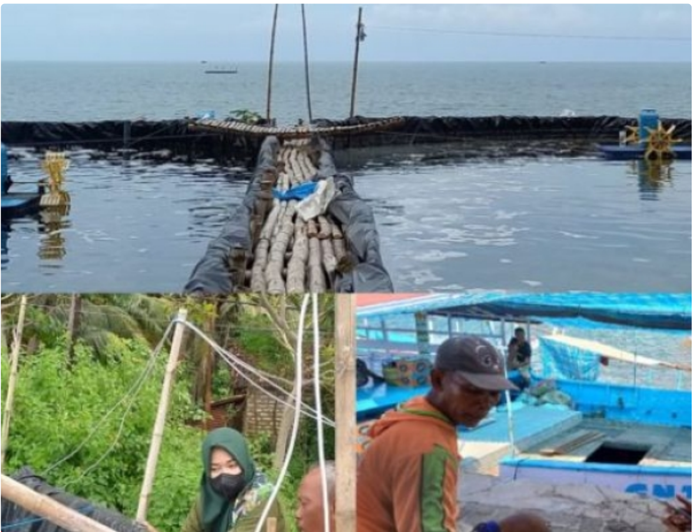
Mahasiswa PWK ITS ketika melaksanakan survei Praktek Perencanaan Pesisir

SURABAYA — Perencanaan Wilayah dan Kota (PWK) Institut Teknologi Sepuluh Nopember (ITS) memiliki salah satu ciri khas yakni menawarkan fokus perencanaan yang berbeda dengan PWK di perguruan tinggi lain. Tidak hanya berfokus pada perencanaan perkotaan dan pedesaan, PWK ITS juga